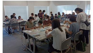
「パステル画を描いてみよう」▲

ダイレクトに団体の活動を伝えるための方法として、日頃の活動を講座にして参加者に伝えるというやり方もあります。今年度はこれまで共催というかたちで、センターに登録頂いている団体と3つの講座を開催しています。