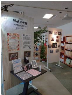
ドキュ山コースの活動展示

日頃の団体の活動をたくさんの人に伝えたい、活動で制作した作品をたくさんの人に見てほしい、そんなときには霞城セントラル 22 階にある市民活動情報コーナー「ふらっと」を使って展示してみませんか？展示期間は最大2週間です。