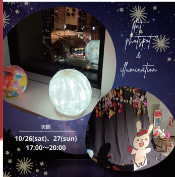
▲NPO収穫祭の告知画像