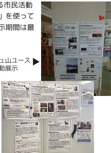
あーちゃんの家と野良猫クラブの展示パネル