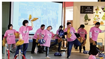
▲ 日本ダウン症協会 山形県支部の皆さんのダンスパフォーマンス