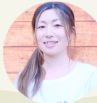
講師はcocotomo代表 まり保育士

物と向き合うことで 自分のことを知り 本当に大切にしたいこと も明確になっていきます